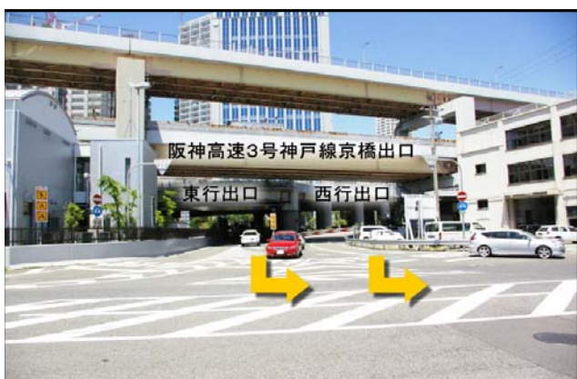
① 京橋出口を出て一般道を左折。 (西行:大阪方面からお越しの方) (東行:姫路方面からお越しの方)