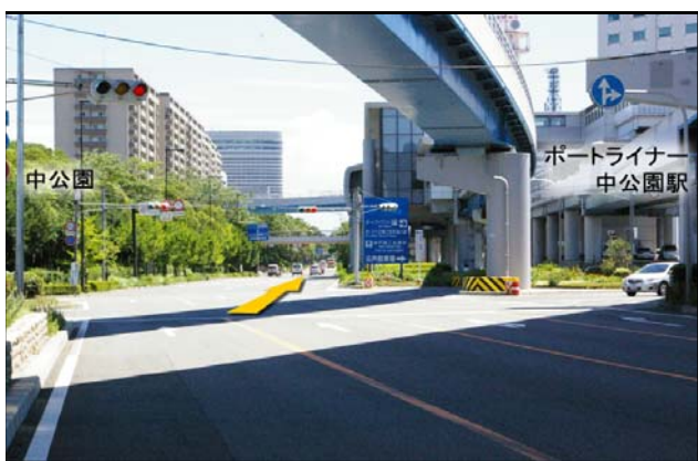
⑤ 渡り切って1つめの信号(交差点)です。 直進して下さい。