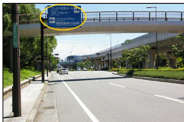
⑥ 渡り切って5つ目と6つ目の信号(交差点)の 間に案内標識があります。