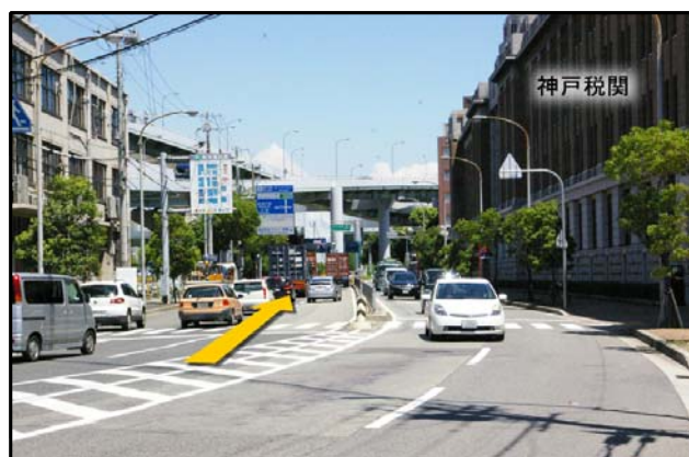
② しばらく道なりに、神戸税関前を通過し (神戸空港・ポートアイランド方面)へ。