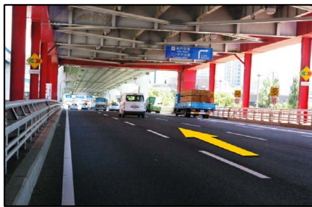
④ 神戸大橋を渡って下さい。