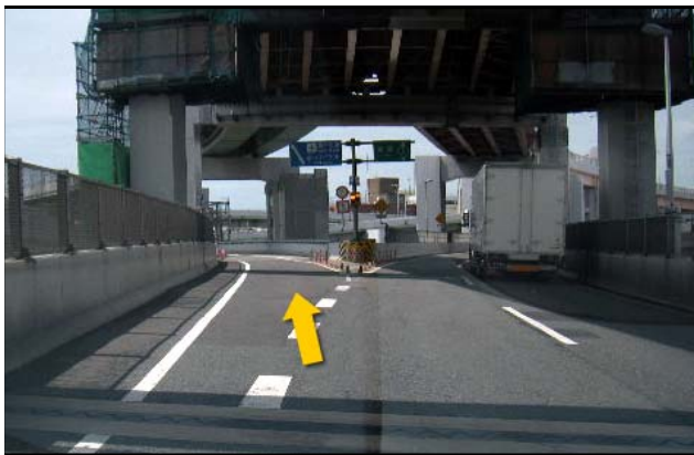
③ 神戸空港・ポートアイランド方面(神戸大橋)へ。