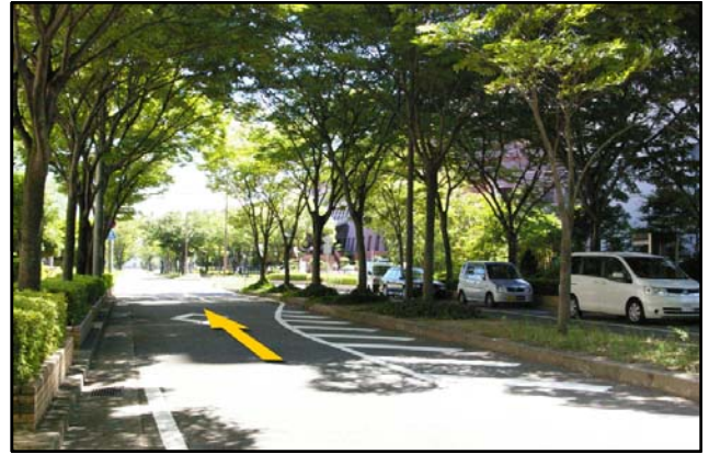
⑧ 道なりに進んでいただくと右前方にワールド記念ホールが見えてきます。