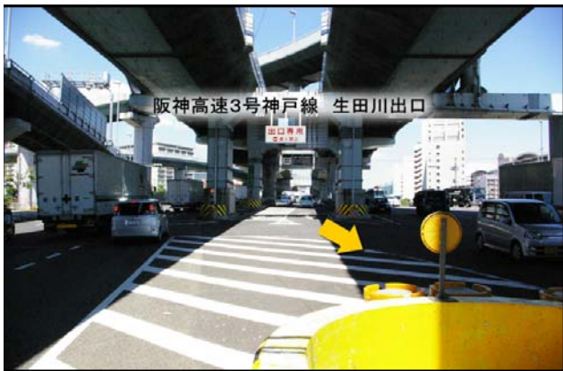
① 生田川出口を出てまっすぐ進んで下さい。