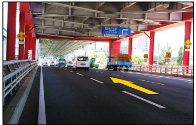
④ 神戸大橋を渡って下さい。