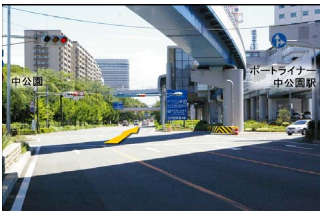
⑤ 渡り切って1つめの信号(交差点)です。直進して下さい。