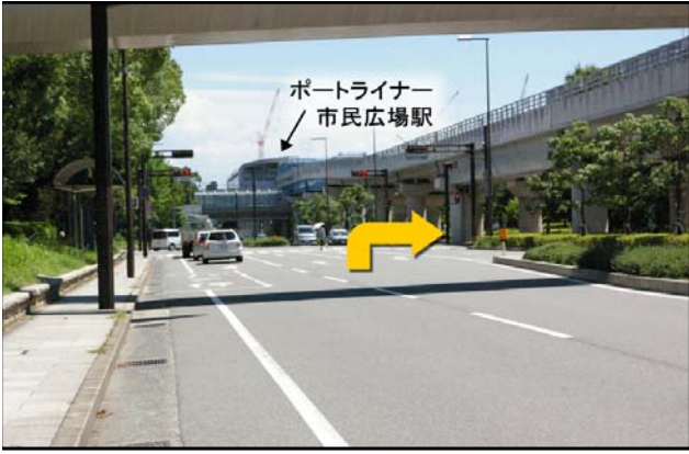
⑦ 案内標識先の6つ目の信号(交差点)を右折。