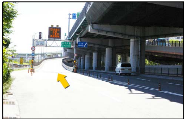
② 前方高架道(国道2号線浜手バイパス)へ。