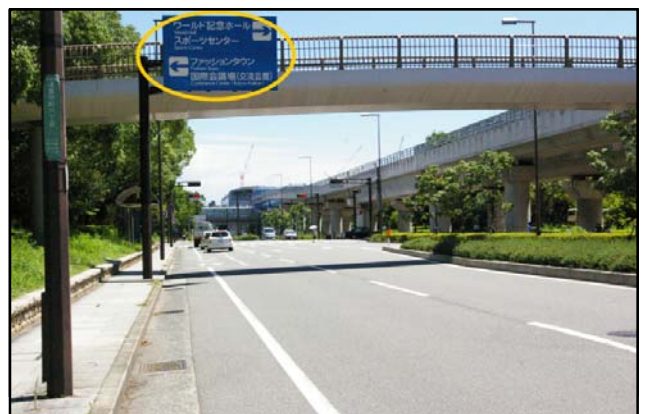
⑥ 渡り切って5つ目と6つ目の信号(交差点)の間に案内標識があります。