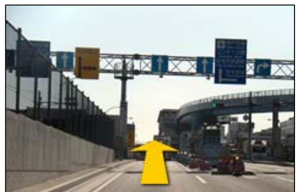
⑥出口を出て、そのまま直進して下さい。