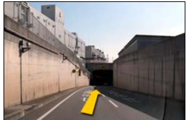
④港島トンネルの入口は一箇所です。