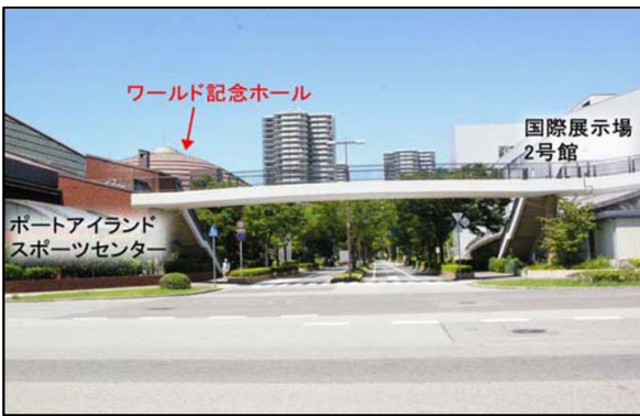
⑪左前方にワールド記念ホールが見えてきます