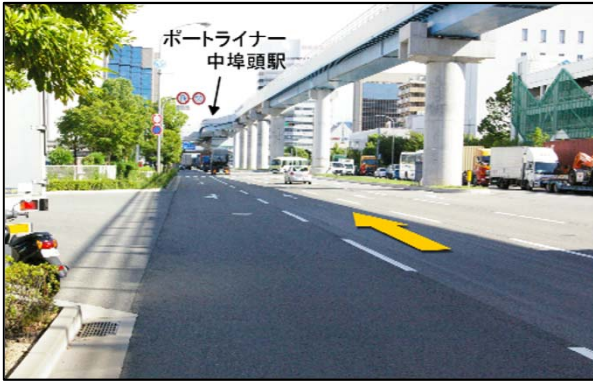
⑦ポートライナーの高架下沿いに、しばらく直進です。