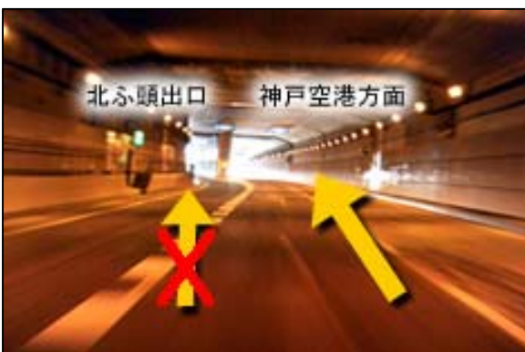
⑤一つ目の出口「北ふ頭出口」では出ないで神戸空港方面に進んで下さい。