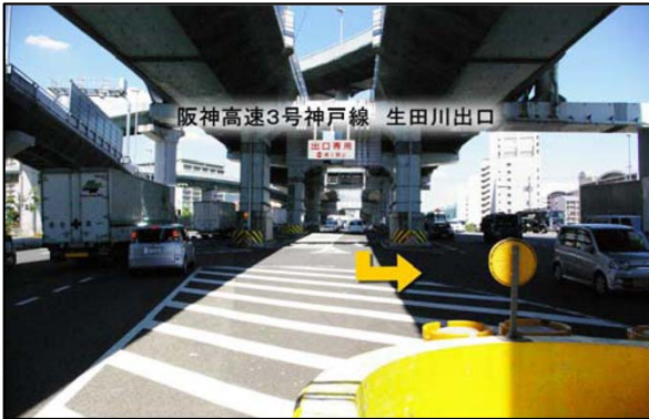
①生田川出口を出て一般道を左折。