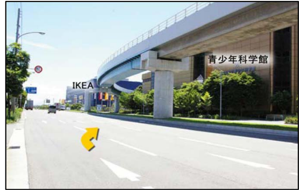
⑧青少年科学館・IKEA前の交差点を右折です。