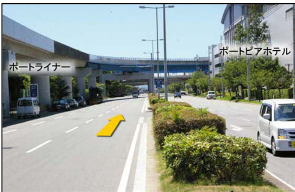
⑨しばらく直進しポートピアホテル前、ポートライナーの高架下を通過。