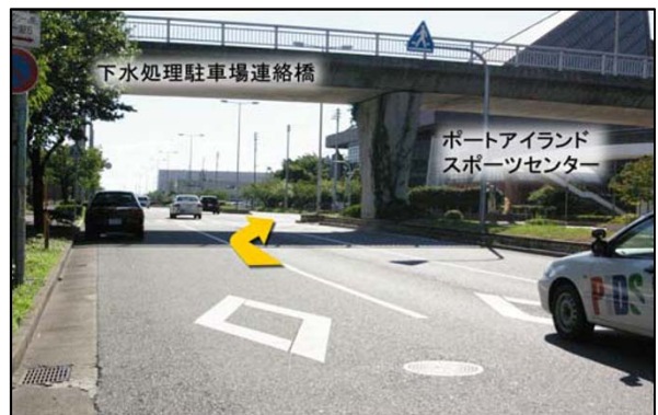
⑩下水処理場駐車場連絡橋を越えてすぐの交差点を右折です